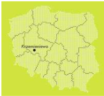
Mapa Gminy Krzemieniewo