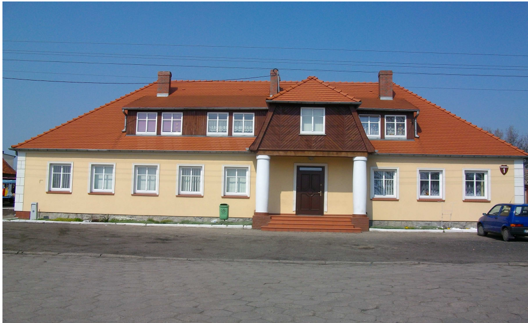
Odnowiony budynek dawnego „Gościńca”