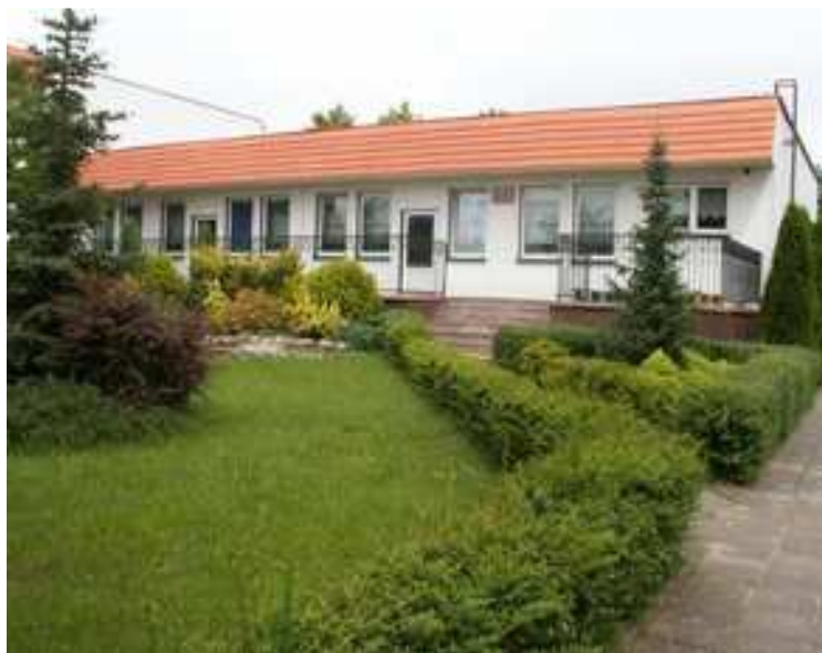
Rys. 4 Przedszkole w Krzemieniewie