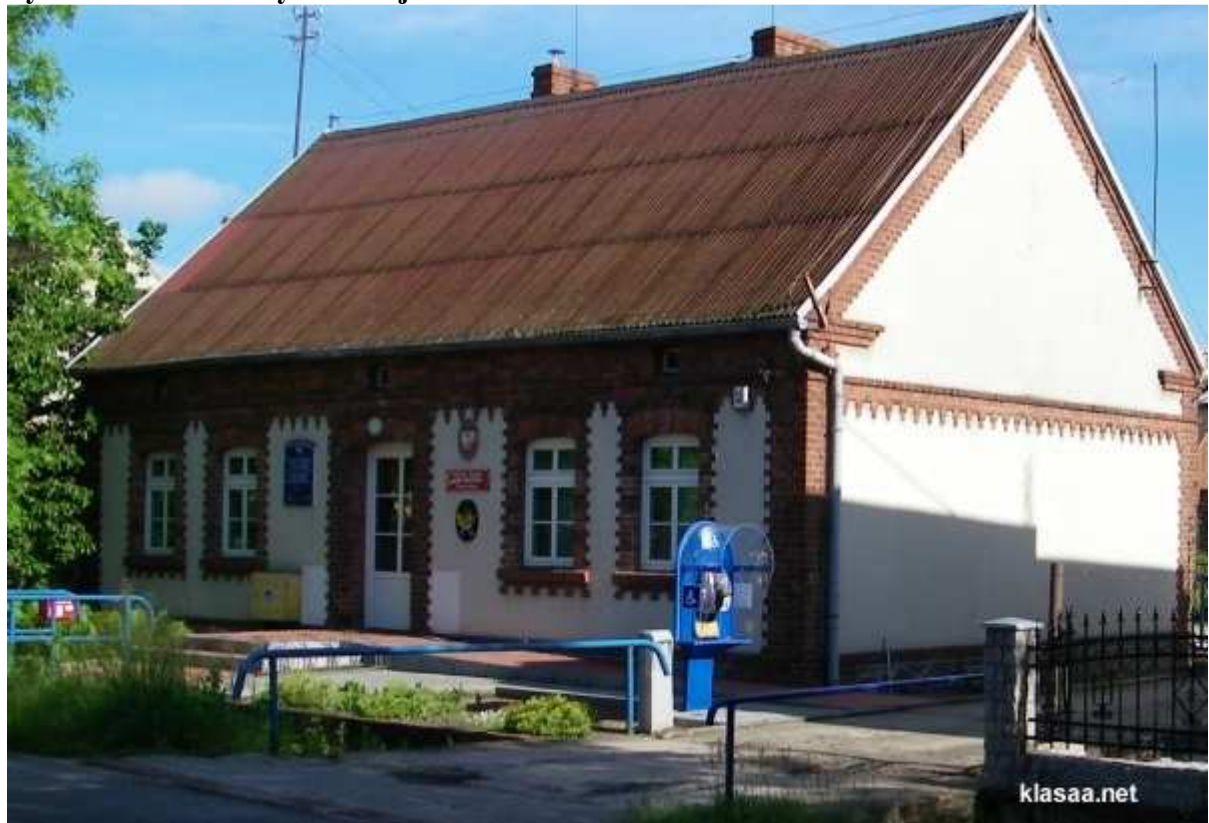
Rys.6 Oddział Poczty Polskiej w Krzemieniewie