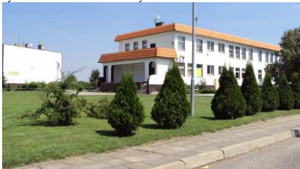
Rys. 5 Gminne Centrum Kultury w Krzemieniewie

Mieszkańcy Krzemieniewa mają możliwość uczestnictwa w imprezach kulturalno-sportowych odbywających się nie tylko w Krzemieniewie, ale także na terenie całej Gminy Krzemieniewo.