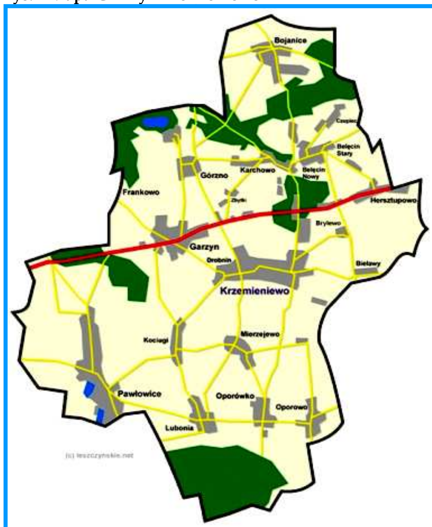
Rys. 1 Mapa Gminy Krzemieniewo

Krzemieniewo położone jest w województwie wielkopolskim, powiecie leszczyńskim. Siedziba gminy Krzemieniewo. Jest jednym z 18 sołectw gminy Krzemieniewo. Druga pod względem ilości mieszkańców miejscowość. Wieś graniczy administracyjnie z następującymi miejscowościami: Drobnin, Bielawy, Brylewo, Hersztupowo, Zbytki,