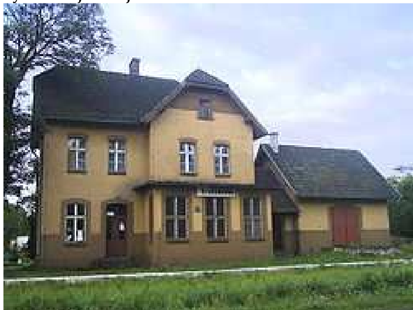
Rys 3. Stacja kolejowa w Krzemieniewie