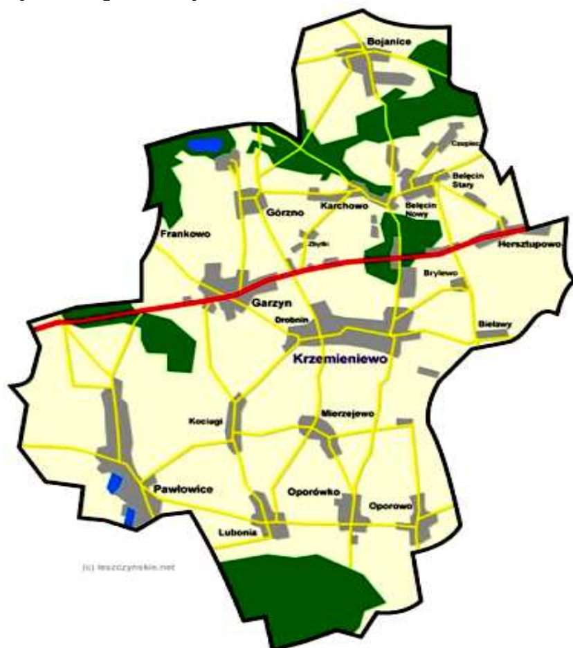
Rys. 1 Mapa Gminy Krzemieniewo