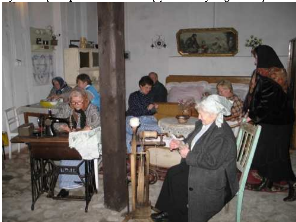
Rys. 7 Wnętrze pomieszczeń należących do Izby Regionalnej

Młodzież wsi Pawłowice utworzyła Młodzieżowy Zespół Taneczny, który często występuje na imprezach organizowanych na terenie gminy Krzemieniewo.