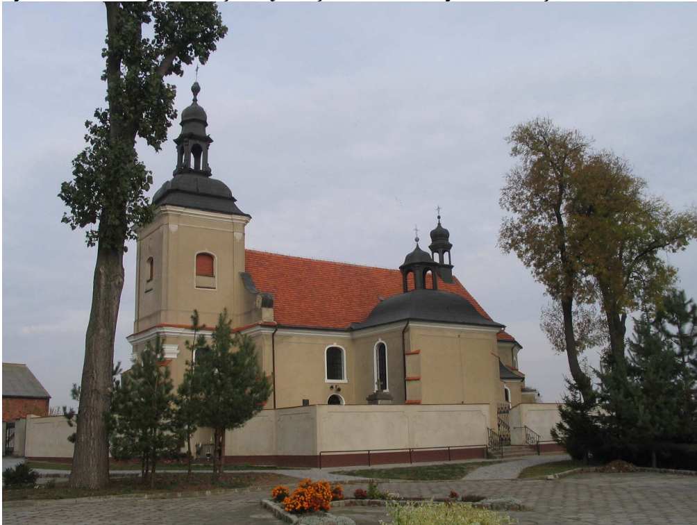
Rys. 3 Kościół p.w. Najświętszej Marii Panny Śnieżnej