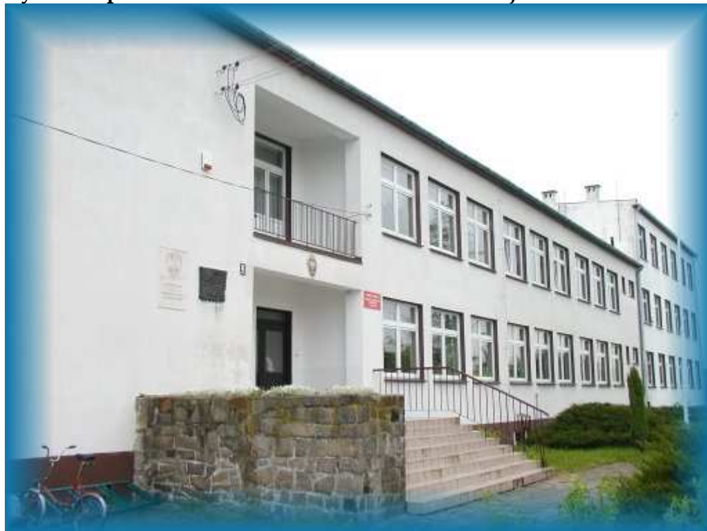
Rys. 6 Zespół Szkół Szkoła Podstawowa i Gimnazjum w Pawłowicach

Obok uczniów z Pawłowic, Kociug, Robczyska do szkoły uczęszczają uczniowie z Oporowa, Oporówka i Luboni. Dzieci z Kociub, Oporowa, Oporówka i Luboni dojeżdżają do szkoły autobusami.