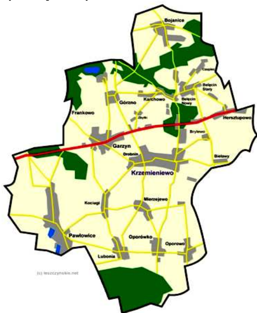
Rys. 1 Mapa Gminy Krzemieniewo

W latach 1975-1998 miejscowość należała administracyjnie do województwa Leszczyńskiego